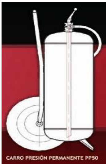
CARRO PRESIÓN PERMANENTE PP50